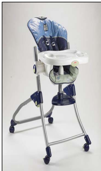
Close to Me™ High Chair