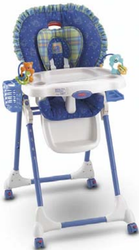
Healthy Care™ High Chair